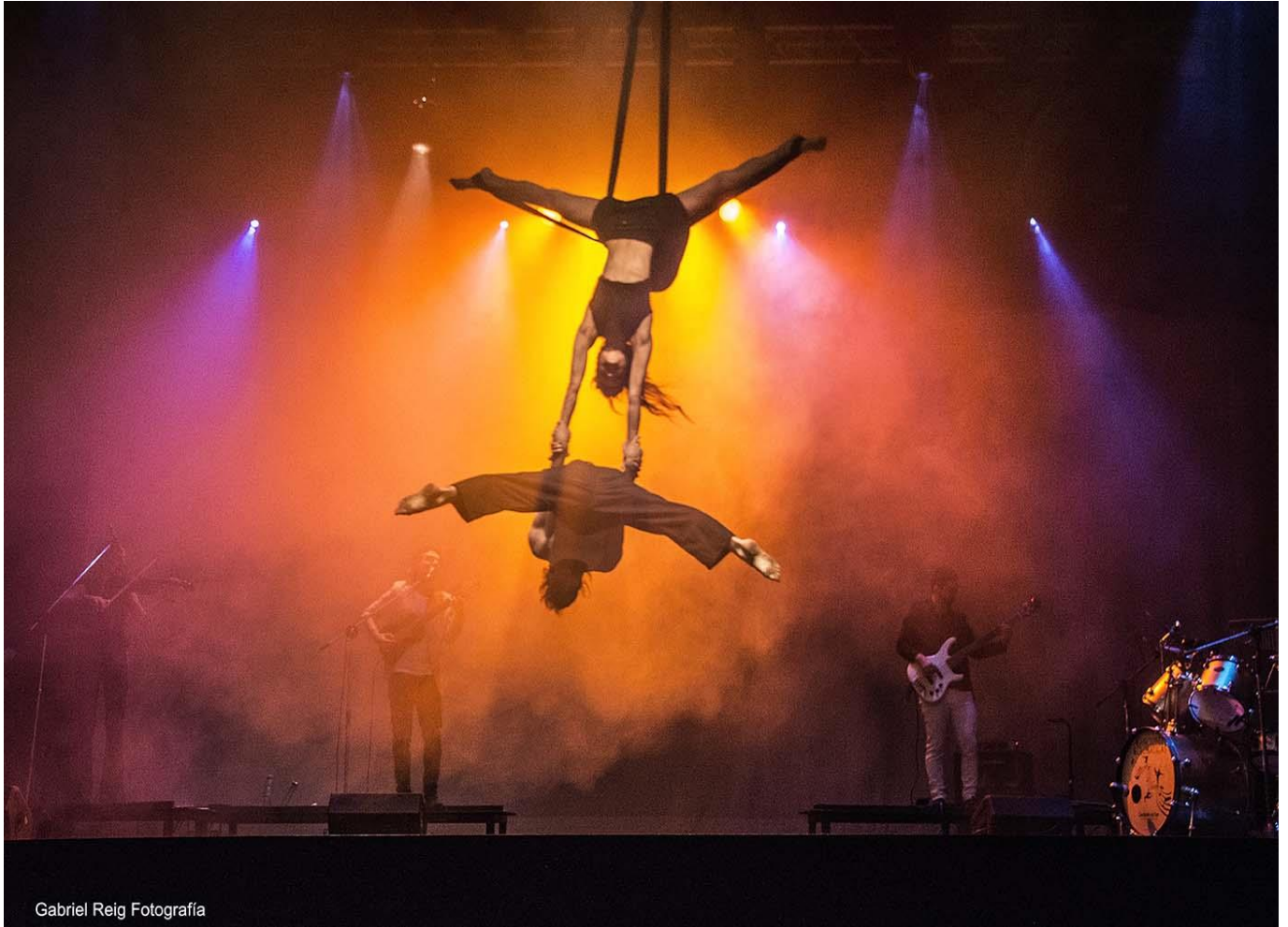
Gabriel Reig Fotografía